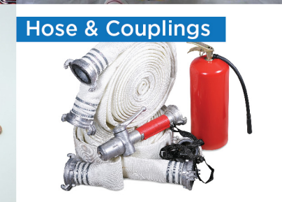
Hose & Couplings