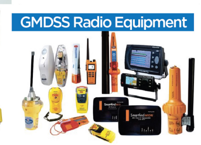
GMDSS Radio Equipment