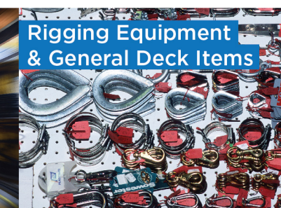
Rigging Equipment & General Deck Items