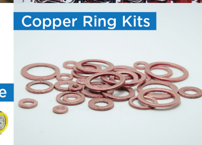
Copper Ring Kits